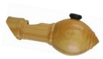
- COUCOU GRIS -